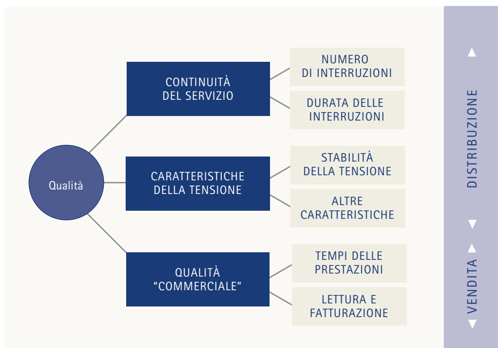
FIG. 6.1 FATTORI DELLA QUALITÀ DEL SERVIZIO DI DISTRIBUZIONE E DI VENDITA DELL'ENERGIA ELETTRICA

La continuità del servizio è il più considerevole tra i diversi fattori di qualità nel settore dell'energia elettrica (Fig. 6.1), sia sotto il profilo della rilevanza per gli utenti, sia per l'incidenza economica degli investimenti necessari a ridurre le interruzioni. L'Autorità ritiene che la continuità del servizio sia un requisito da affrontare prioritariamente rispetto ad altri fattori tecnici di qualità del servizio, che pure rivestono un'importanza significativa per certi utenti, come la stabilità della tensione e perturbazioni quali buchi di tensione, tensioni armoniche, flicker , dissimmetria tra le fasi.