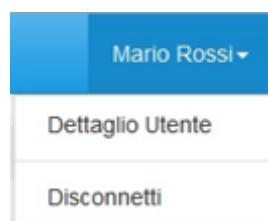
Figura 1.3: sezione utente

Nel riquadro verde della Figura 1.2 sono mostrati nome e cognome della persona che ha effettuato l'accesso al sistema. Tale voce consente di disconnettersi dal sistema attraverso il tasto Disconnetti o di visualizzare, tramite il tasto Dettaglio Utente (Figura 1.3), le informazioni dell'operatore (Figura 1.4).