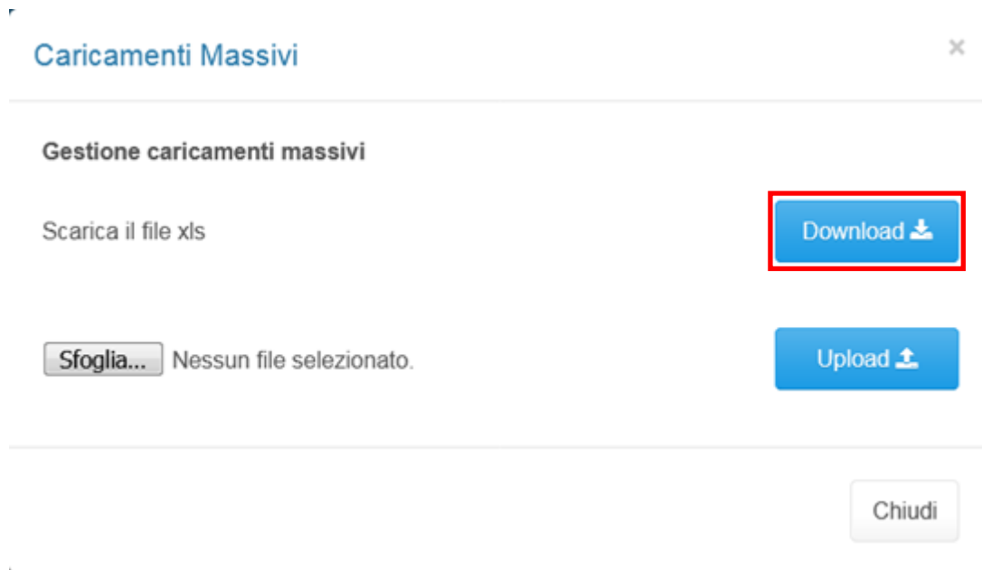
Figura 2.3: caricamento massivo

Per utilizzare tale modalità basta premere il tasto “ Caricamenti Massivi (xls) ”. Il sistema presenterà una maschera come in Figura 2.3: