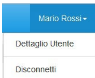
Figura 2.3: sezione utente

Nel riquadro giallo della figura 2.2 sono mostrati nome e cognome della persona che ha effettuato l'accesso al sistema. Tale voce consente di disconnettersi dal sistema attraverso il bottone Disconnetti o di visualizzare, tramite il bottone Dettaglio Utente (figura 2.3), le informazioni dell'operatore (figura 2.4).