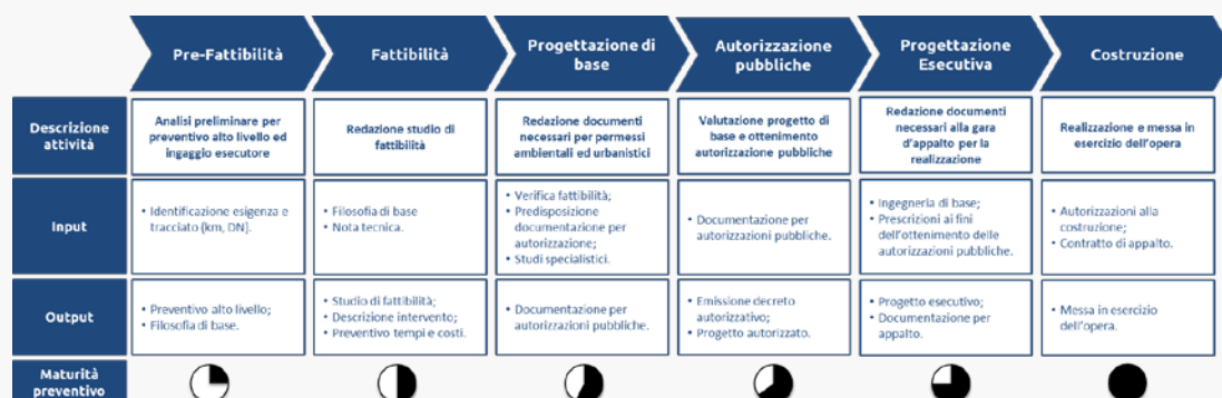
Figura 1 – Le fasi del ciclo di preventivazione costi