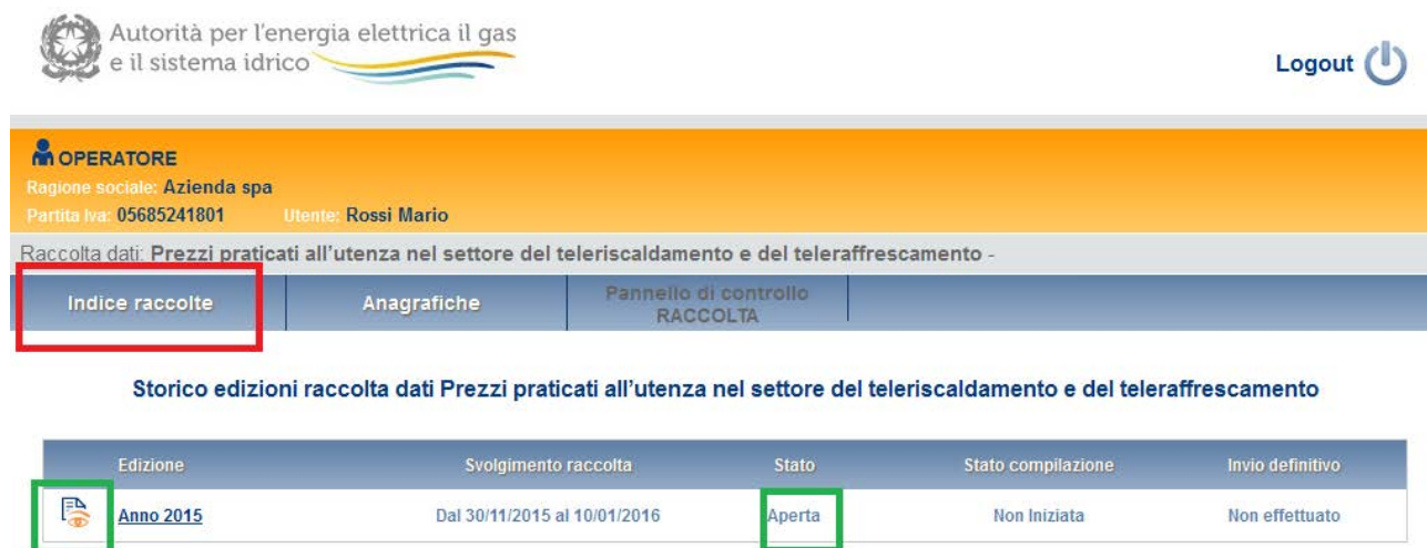
Figura 2.2: storico della raccolta