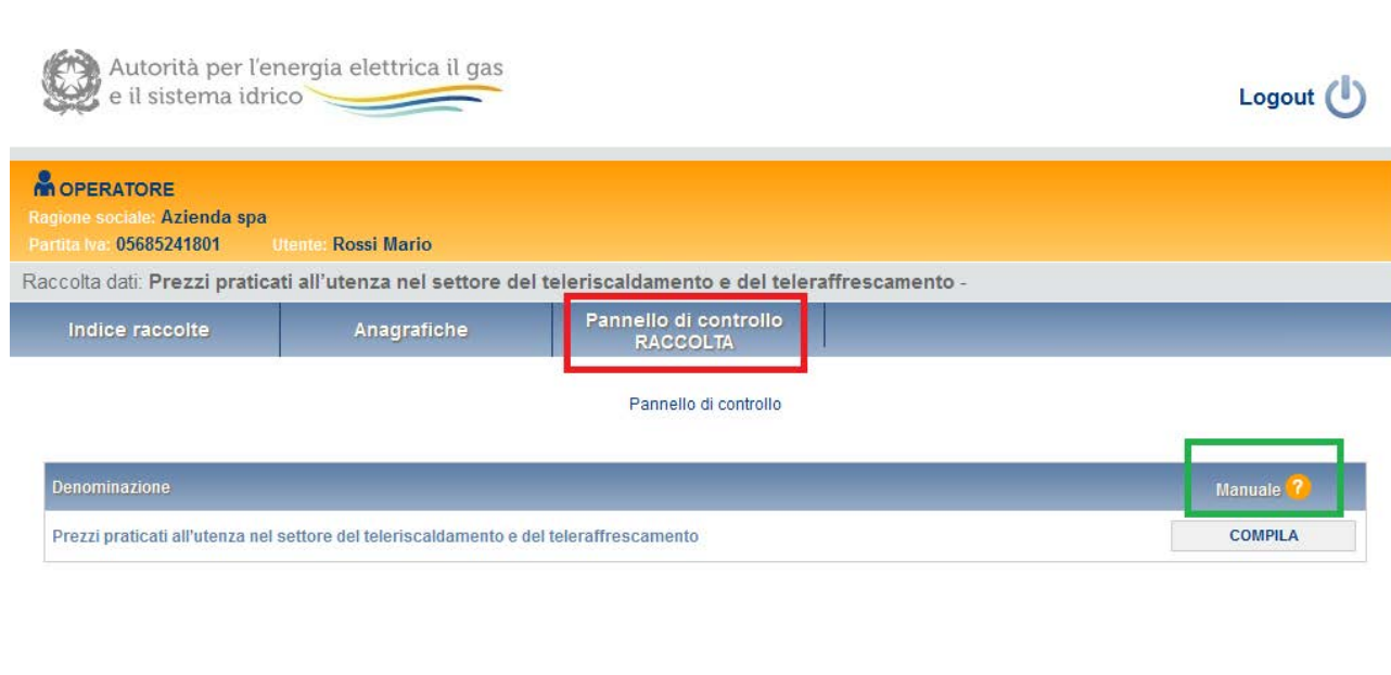
Figura 3.1: pannello di controllo

Accedendo alla raccolta viene visualizzata la pagina “ Pannello di controllo ” dove sono presenti le maschere da compilare per la raccolta (riquadro rosso in figura 3.1): Nel caso in questione è presente una sola maschera, il cui nome coincide con quello della raccolta.