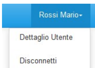
Figura 2.3: sezione Utente

Nella medesima pagina, in alto a destra, sono mostrati nome e cognome della persona che ha effettuato l'accesso al sistema ( riquadro verde della Figura 2.2). Tale voce consente di disconnettersi dal sistema attraverso il bottone “ Disconnetti ” o di visualizzare, tramite il bottone “ Dettaglio Utente ” (Figura 2.3), le informazioni sull'operatore (Figura 2.4).