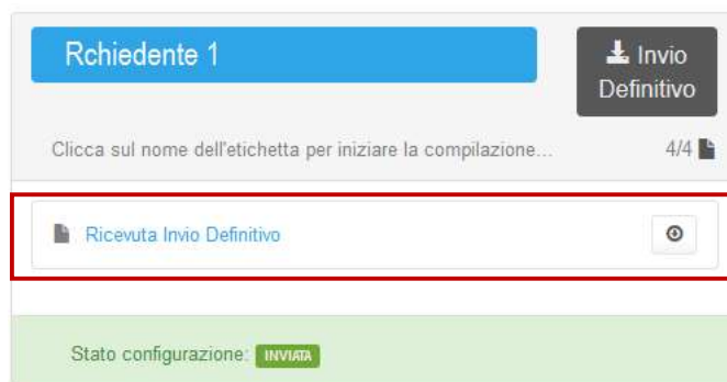
Figura 3.6: link ricevuta Invio definitivo all'interno dell'elenco configurazioni

ATTENZIONE: ad "Invio definitivo" effettuato le maschere non sono più modificabili.