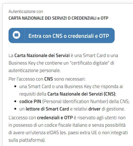
Figura 2.1: pagina di login

A seguito dell'autenticazione, l'operatore verrà indirizzato alla pagina “Elenco Raccolte”, che mostra l'elenco delle raccolte dati a cui l'operatore è abilitato; tra queste troverà la presente raccolta “Presentazione istanze TEL e CON (misura del gas naturale)” (riquadro rosso in Figura 2.2).