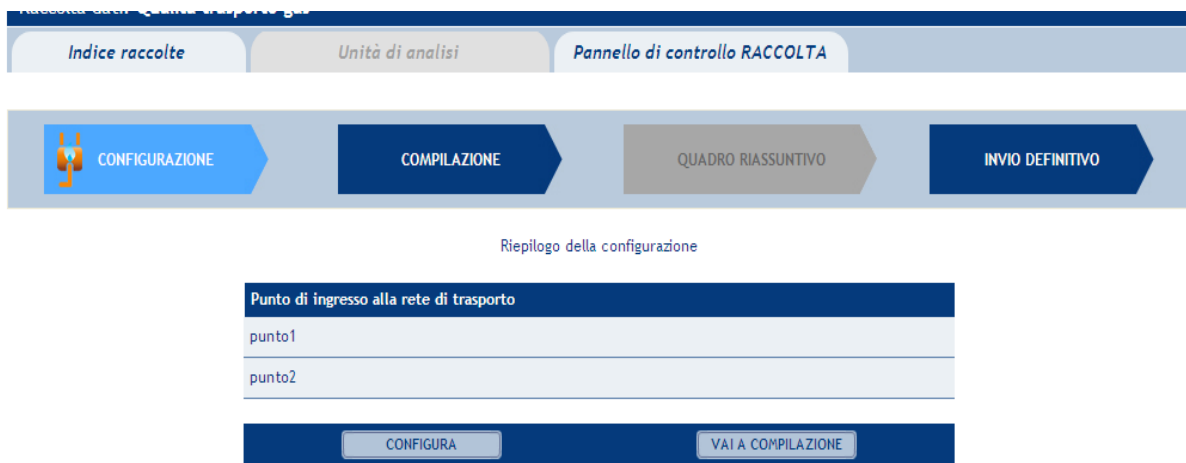
Figura 3.1: Riepilogo della configurazione

Premendo il pulsante “VAI A COMPILAZIONE”, invece, si passerà alla fase di compilazione.