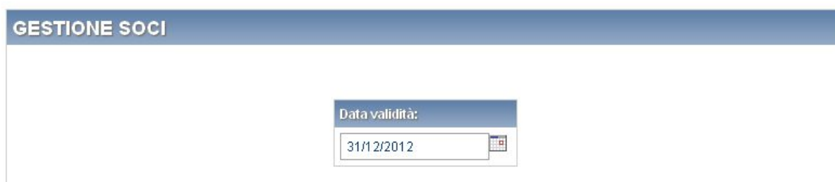
Figura 4.1: Inserimento della data validità

Non è possibile selezionare date antecedenti al 31/12/2012.