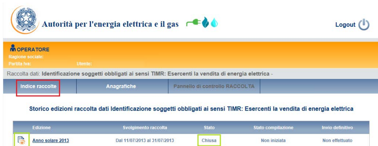
Figura 1.2: Storico della raccolta