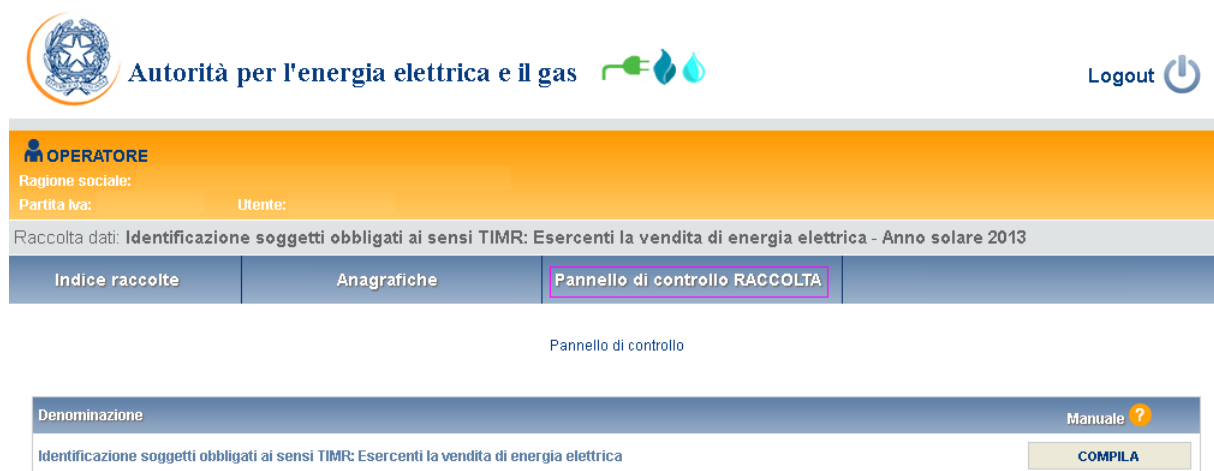
Figura 2.1: Pannello di controllo della raccolta

Accedendo alla raccolta viene visualizzata la pagina Pannello di controllo (figura 2.1) dove sono presenti tutte le voci inerenti a questa raccolta.