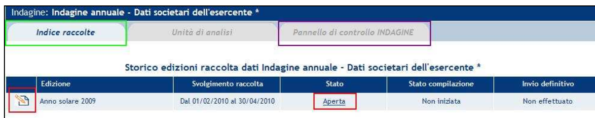
Figura 1.2: Storico della raccolta